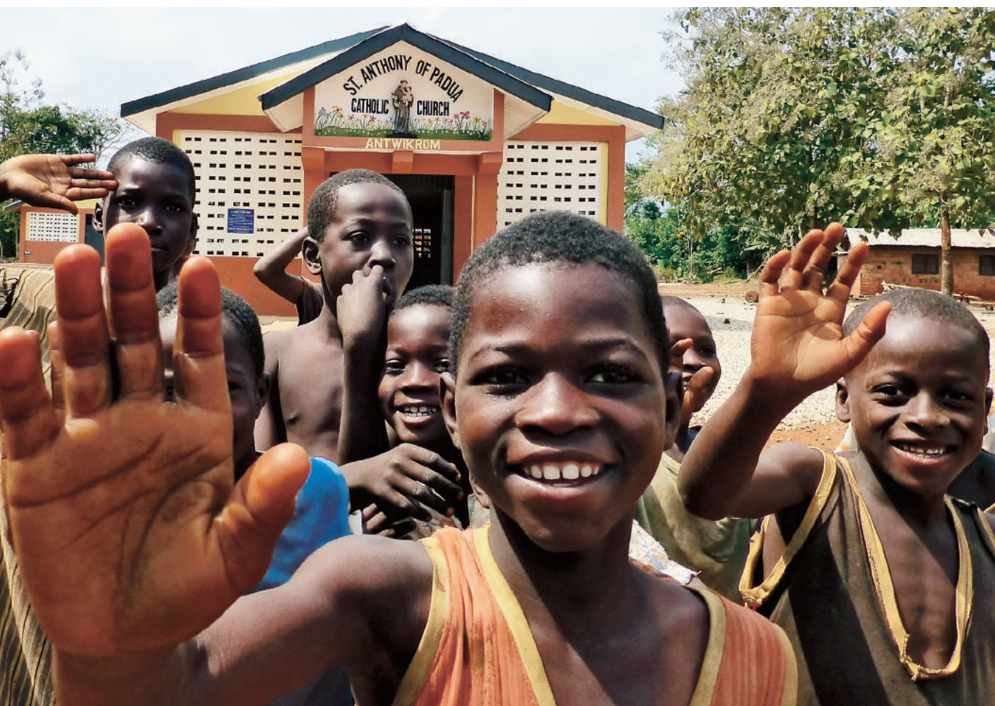
ARCHIVIO CARITAS ANTONIANA